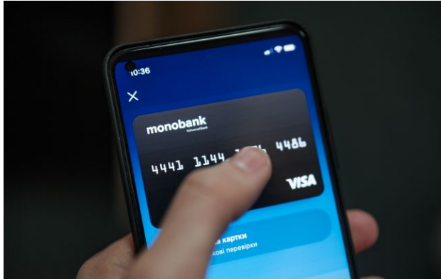
Фото: у роботі Монобанк стався збій

У роботі мобільного застосунку Монобанк сьогодні вдень, 29 квітня, стався збій. Користувачі скаржаться на неможливість зайти у застосунок.