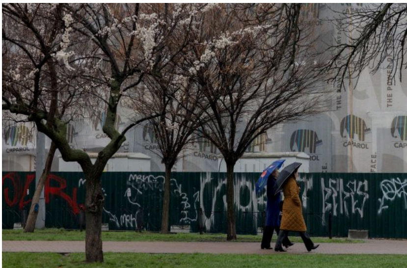
Погода в Україні найближчими днями може змінитись