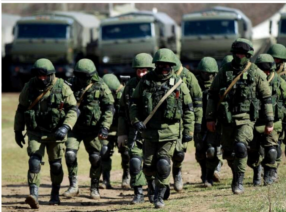
Окупанти використовують Великдень, щоб підтягнути резерви та посилити позиції, - DeepState

Як і минулого року, російські окупаційні війська використовують так зване "великоднє перемир'я" для покращення свого становища на позиціях.