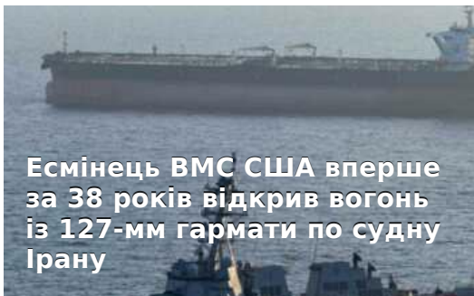
Есмінець ВМС США вперше за 38 років відкрив вогонь із 127-мм гармати по судну Ірану