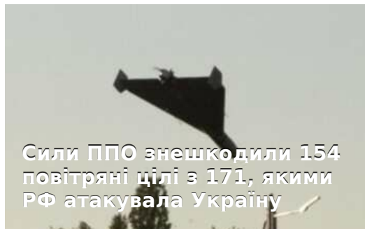
Сили ППО знешкодили 154 повітряні цілі з 171, якими РФ атакувала Україну