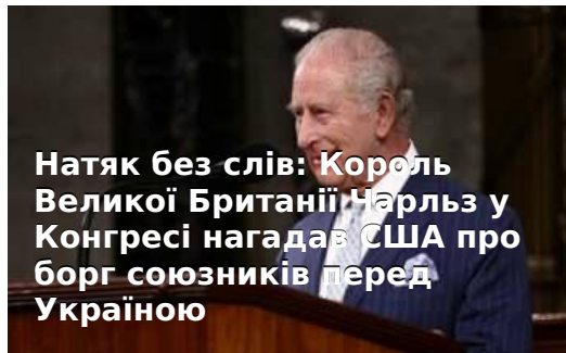
Натяк без слів: Король Великої Британії Чарльз у Конгресі нагадав США про борг союзників перед Україною