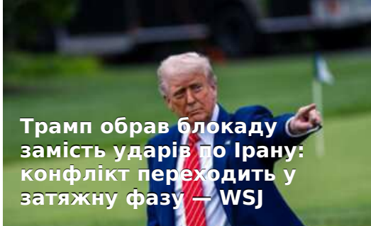
Трамп обрав блокаду замість ударів по Ірану: конфлікт переходить у зтяжну фазу — WSJ