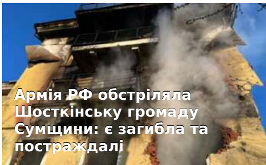
Армія РФ обстріляла Шосткінську громаду Сумщини: є загибла та постраждалі