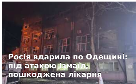
Росія вдарила по Одещині: під атакою Ізмаїл, пошкоджена лікарня