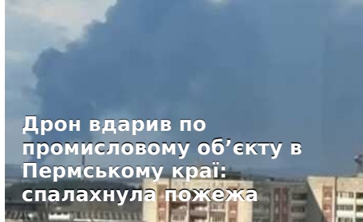
Дрон вдарив по промислому об'єкту в Пермському краї: спалахнула пожежа