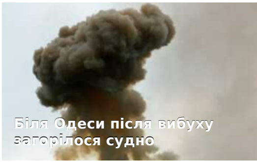
Біля Одеси після вибуху загорілося судно