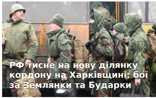
РФ тисне на нову ділянку кордону на Харківщині: бої за Землянки та Бударки