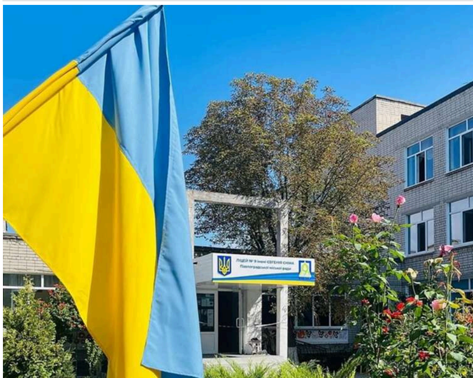
116 мільйонів за укриття: добудувати ліцей у Павлограді буде підрядник із шлейфом недоробок

Відділ освіти Павлоградської міськради замовив завершальні роботи з будівництва захисної споруди цивільного захисту Ліцею № 9 імені Євгенія Єніна.