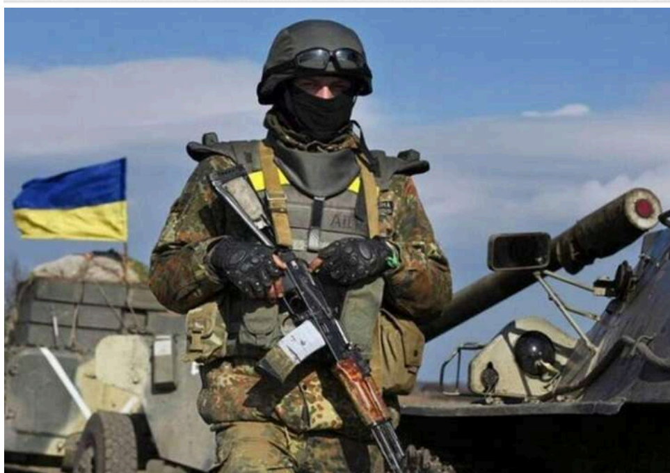
Ситуація на фронті: 91 боєзіткнення за добу, Покровський та Костянтинівський напрямки залишаються найгарячішими точками

Загалом від початку цієї доби сталося 91 бойове зіткнення. Росія задіяла для ураження 4767 дронів-камікадзе та здійснила 840 обстрілів населених пунктів і позицій наших військ.