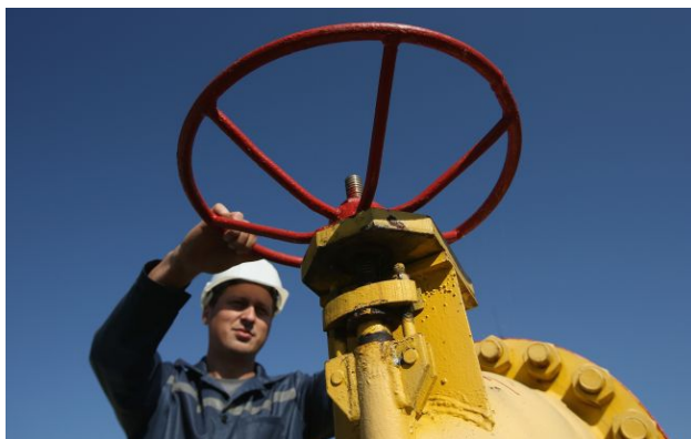
Фото: Миколаївка Донецької області залишилась без газу через удари РФ (Getty Images)

Через критичні пошкодження інфраструктури після російських обстрілів місто Миколаївка на Донеччині залишилось без газу.