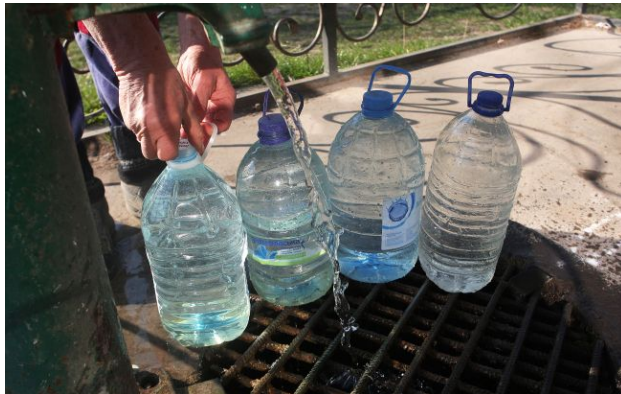
Фото: РФ може атакувати об'єкти водозабору

Росія може влітку атакувати об'єкти водозабору, що здатне залишити без води цілі міста України, особливо у прифронтових та південно-східних регіонах.