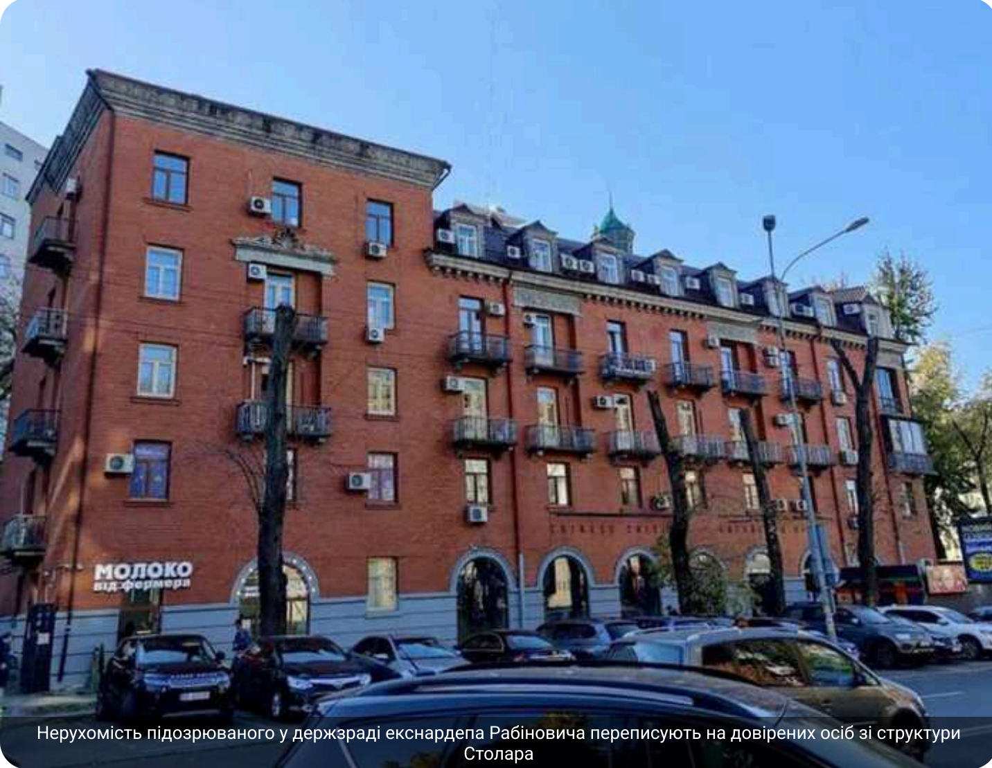
Нерухомість підозрюваного у держзраді екснардепа Рабіновича переписують на довірених осіб зі структури Столара

Активи Вадима Рабіновича все ще змінюють власників – і деякі з цих історій є доволі промовистими.