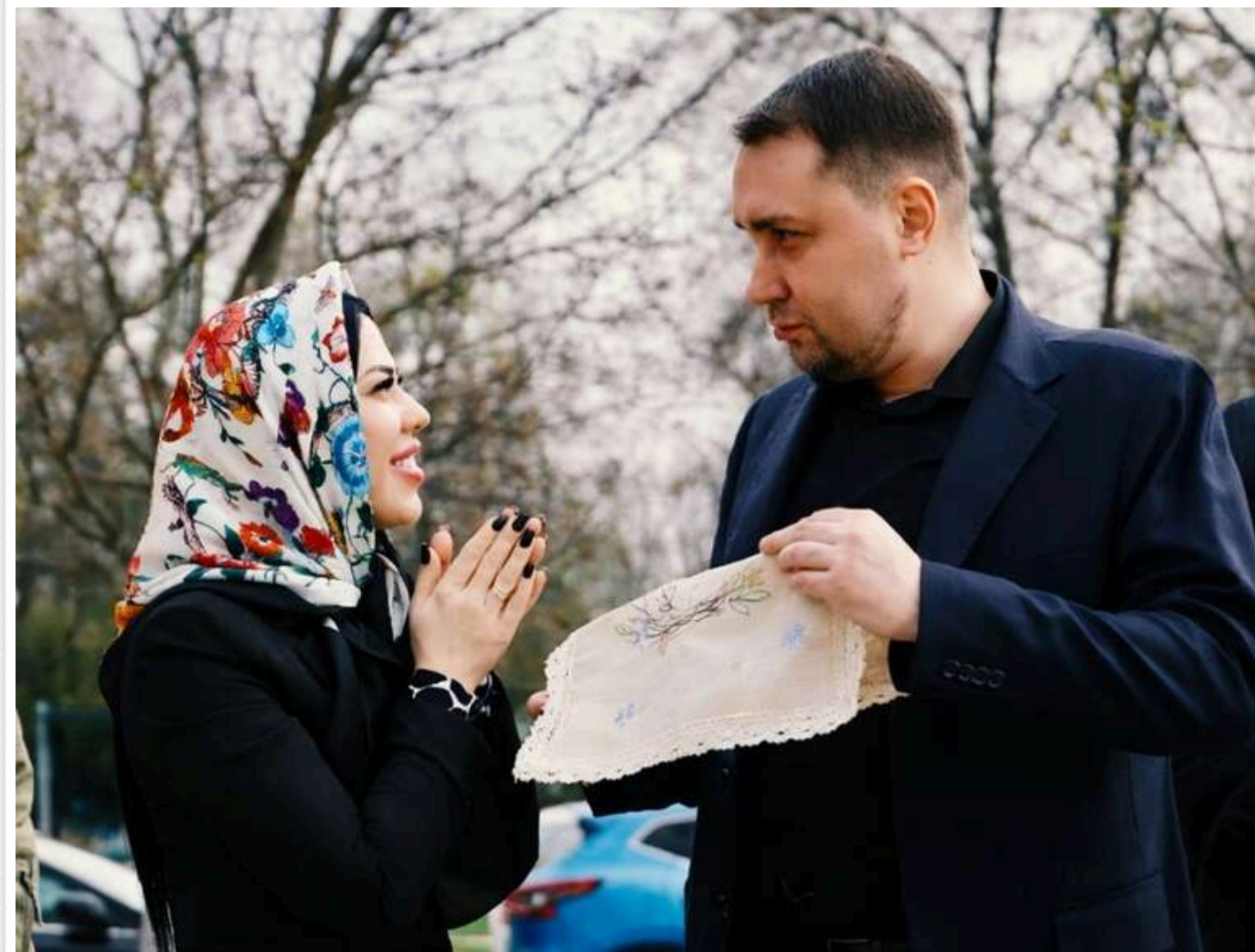
Очільник Офісу Президента України Кирило Буданов розповів про великодні традиції своєї родини

Читати на руском Read in English Додати як бажане джерело в Google