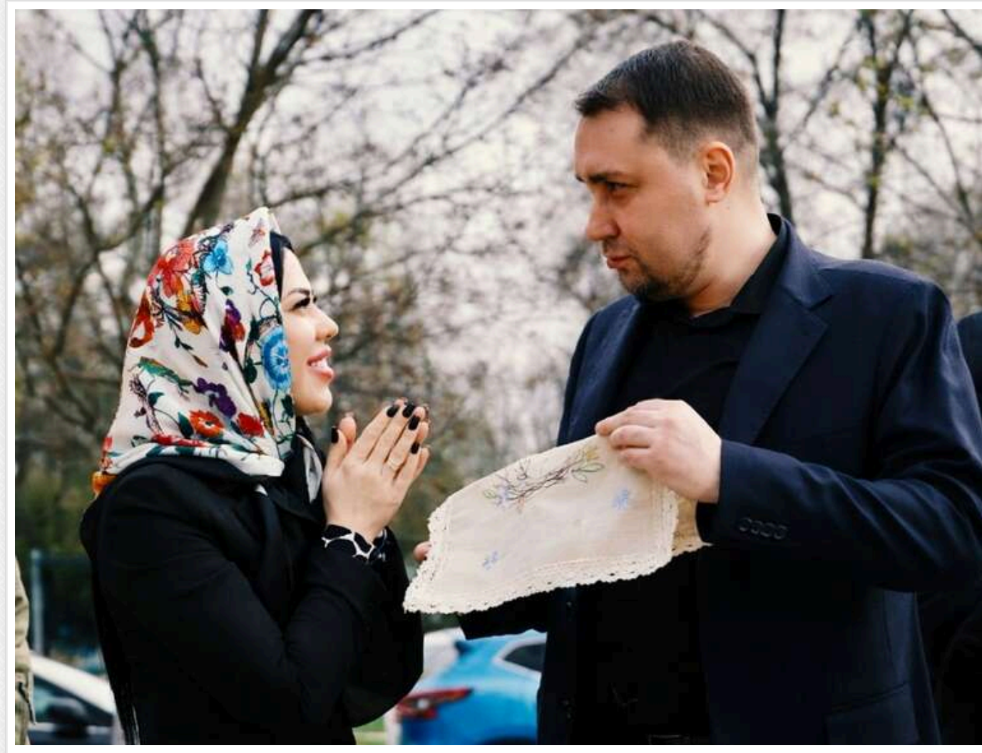
Очільник Офісу Президента України Кирило Буданов розповів про великодні традиції своєї родини

Очільник Офісу Президента Кирило Буданов поділився тим, що цьогоріч разом з дружиною Маріанною поклав у великодній кошик. За його словами, паску самостійно не випікали, а от яйця розфарбовували власноруч.