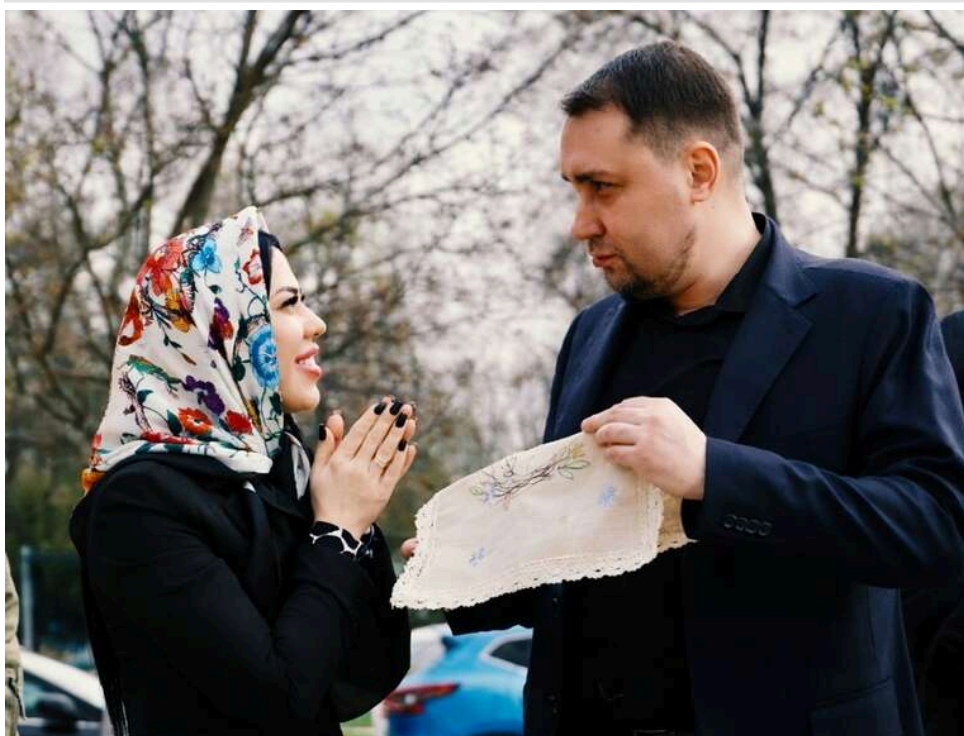
Очільник Офісу Президента України Кирило Буданов розповів про великодні традиції своєї родини

Очільник Офісу Президента Кирило Буданов поділився тим, що цьогоріч разом з дружиною Маріанною поклав у великодній кошик. За його словами, паску самостійно не випікали, а от яйця розфарбовували власноруч.