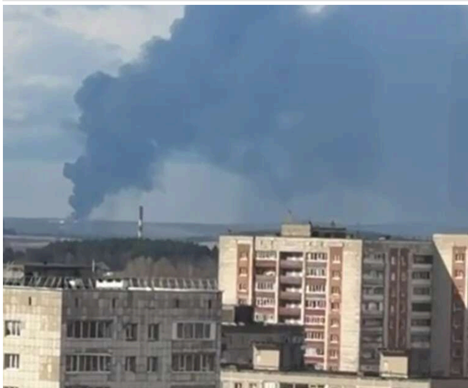
Дрони дісталися Уралу: в Пермському краї РФ після атаки БпЛА палає промисловий об'єкт

Губернатор Пермського краю повідомив про атаку безпілотною на промисловий майданчик у регіоні.