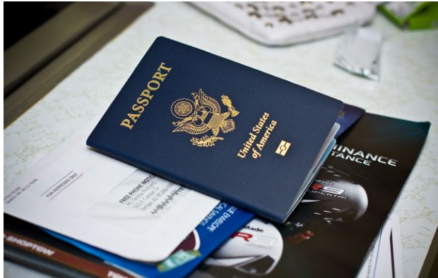
Фото: паспорт США (Getty Images)

У Сполучених Штатах запроваджують унікальні закордонні паспорти до великого ювілею країни. На сторінках документа вперше з'явиться портрет чинного глави держави Дональда Трампа.