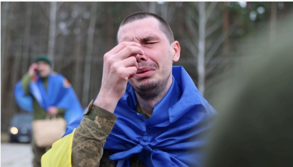
Фото з обміну полоненими 11 квітня

У Коордштабі повідомили, що наймолодшому звільненому – 22 роки, найстаршому – 63.