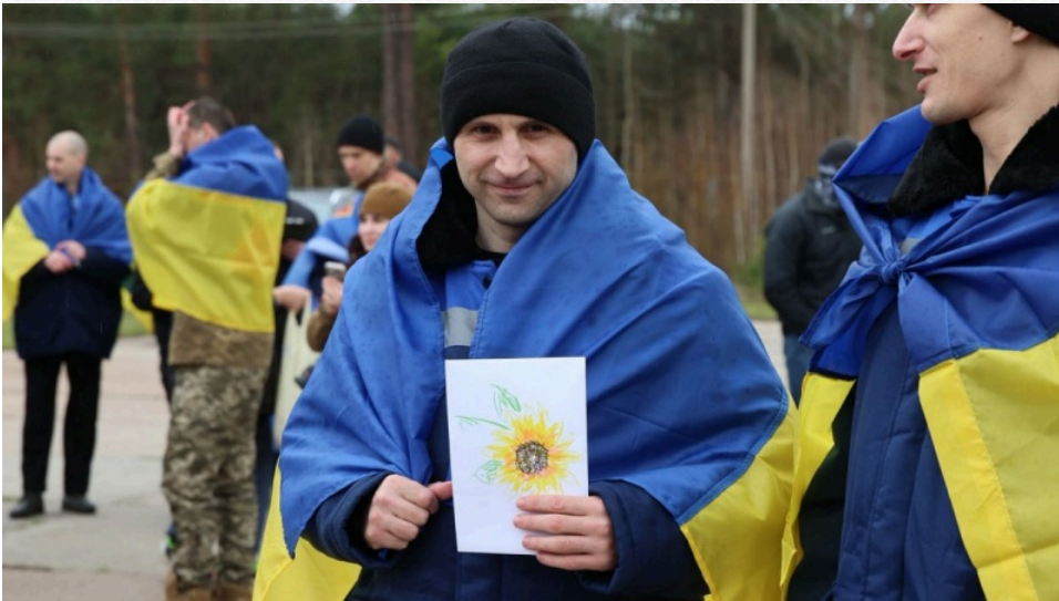
Фото: Україна та РФ провели обмін полоненими ( t.me/Kyrylo_Budanov_Official )

Глава Офісу президента Кирило Буданов уточнив , що в рамках обміну повернуто 182 українці – 175 військових та 7 цивільних.