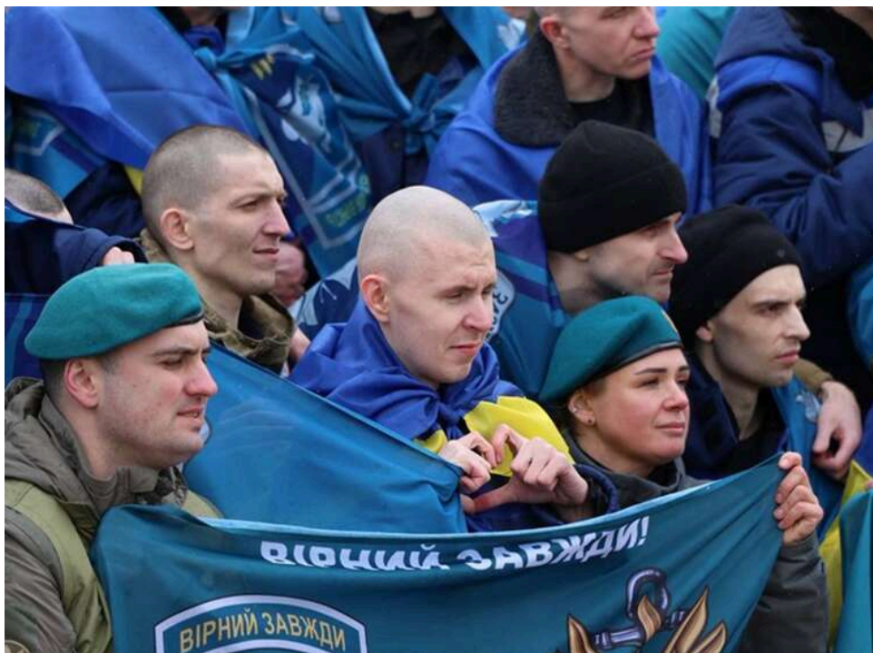
Україна та РФ провели "великий Великодній обмін": з'явилися фото звільнених українців

Україна та Росія здійснили великий обмін полоненими напередодні Великодня. Удалося повернути додому 175 воїнів та 7 цивільних осіб.