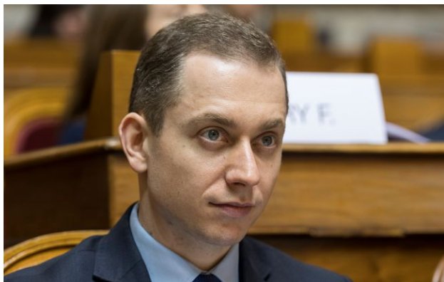
Фото: заступник міністра оборони Польщі Цезарій Томчик (Getty Images)

Польща планує випробувати власне озброєння в реальних бойових умовах на українському фронті. Про це заявив заступник міністра оборони Польщі Цезарій Томчик. Варшава також розглядає спільне виробництво дронів з Україною на польській території.