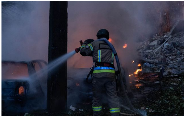
Фото: наслідки російської атаки уточнюються

Вночі 29 квітня окупанти атакували Шосткинську громаду на Сумщині та Харківщину. На Сумщині від отруєння чадним газом загинула 60-річна жінка, ще двоє людей постраждали. На Харківщині пошкоджено житлові будинки в кількох районах.