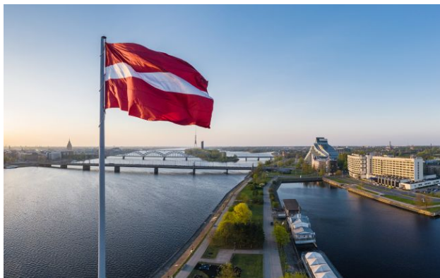
Фото: штраф отримав і митний брокер (Getty Images)

Ризький міський суд оштрафував підприємця на 10 140 євро за спробу порушити санкції ЄС. Він намагався експортувати до Росії захисні реле для трансформаторів вартістю понад 161 тисячу євро.