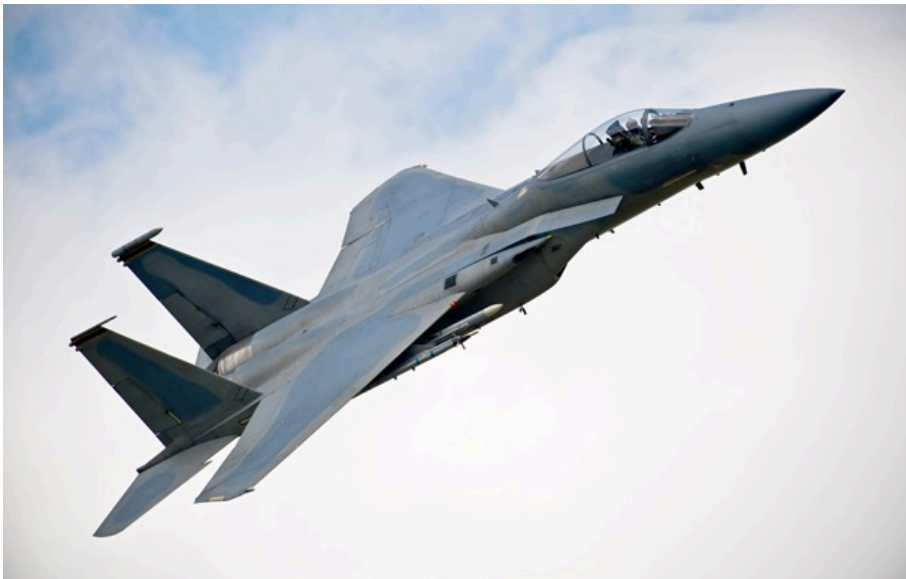
Американський винищувач F-15

Це перший ймовірний випадок від початку війни, коли американський літак було збито вогнем противника.