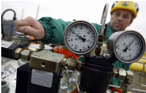
Фото: працівник 'Газпрому' (Getty Images)

Боснія і Герцеговина підписала контракт на будівництво газопроводу з компанією оточення Дональда Трампа. ЄС попереджає про загрозу вступу до блоку через непрозорість угоди.