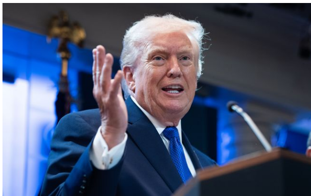
Фото: президент США Дональд Трамп (Getty Images)

Американські спецслужби за запитом Білого дому аналізують, як Іран відреагує, якщо Трамп в односторонньому порядку оголосить перемогу у двомісячній війні. Рішення не прийнято, однак політичний тиск на президента зростає.