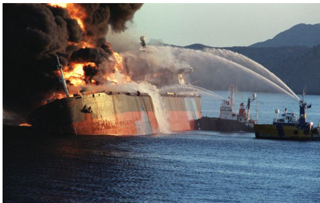
Фото: нафтовий танкер в Ормузькій протоці

Міністр енергетики США Кріс Райт заявив, що для відновлення судноплавства через Ормузьку протоку не потрібно прибирати всі міни - достатньо розчистити один коридор для проходу суден. За його словами, це може відбутися швидко.