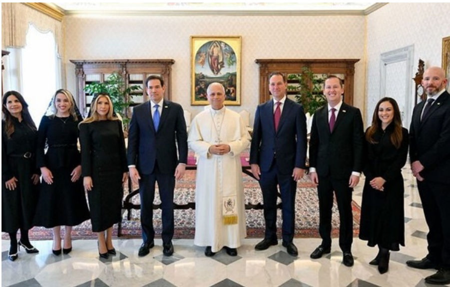
Зустріч делегації США на чолі з Марко Рубіо і Папи Римського Лева XIV у Ватикані

Сторони наголосили, що особливу увагу вони приділили країнам, де йде війна, та "необхідності невинно працювати заради миру".