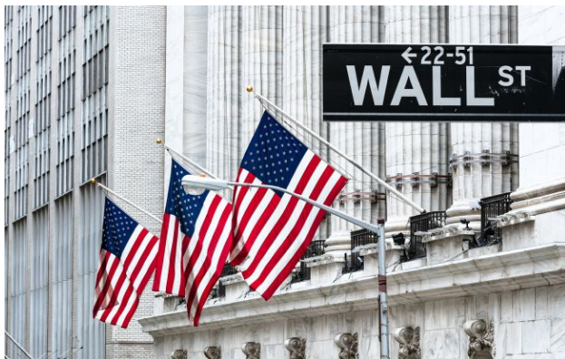
Фото: Вашингтон погрожує Пекіну санкціями

США запровадили санкції проти 35 осіб і структур, причетних до тіньової банківської системи Ірану. Окремо Вашингтон попередив банки, які працюють із китайськими нафтопереробними заводами, що платять Тегерану за прохід через Ормузьку протоку.