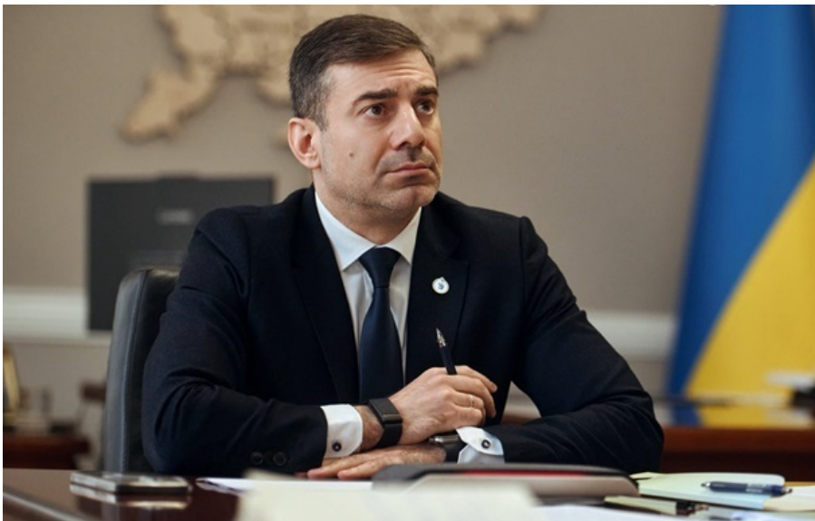
Дмитро Лубінець