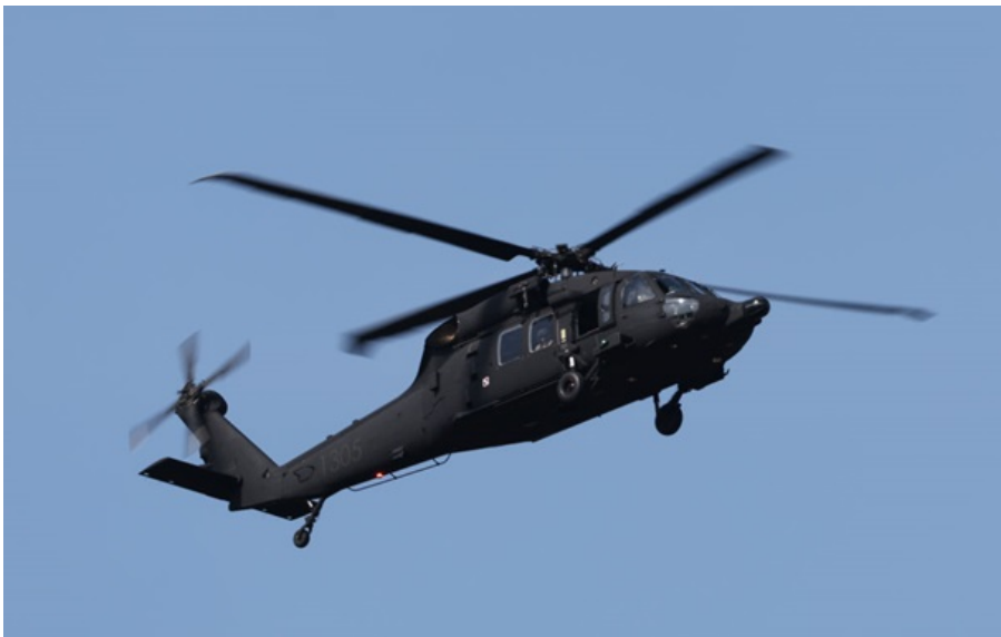
Американський вертоліт Black Hawk

За словами представника американської влади, всі члени екіпажу знайдені й перебувають у безпеці.