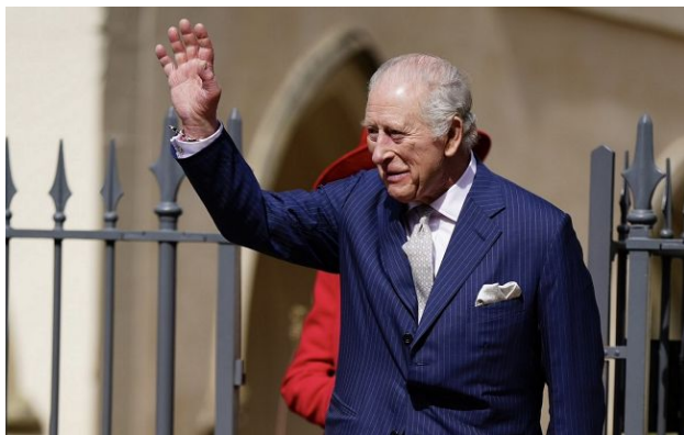
Фото: король Великої Британії Чарльз III

Король Британії Чарльз III піл час свого візиту до Вашингтону, присвяченому 250-ї річниці Декларації незалежності США, виступив перед Конгресом США. Він закликав до подальшої підтримки України на тлі погроз Трампа та торкнувся тем НАТО і глобального потепління.