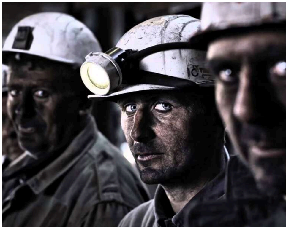
Енергетична катастрофа на окупованому Донбасі: три ключові шахти йдуть на банкрутство

Найбільше промислове підприємство Донбасу остаточно йде на дно під управлінням компанії «Донские угли», яку асоціюють з кумом Путіна. Три головні активи регіону – «Червоний партизан», «Должанська-Капітальна» і шахта імені Свердлова – ініціювали процедуру банкрутства, про це пише російське видання.