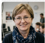
Марія Войтенко ОГЛЯДАЧ НОВИН

Теги: Кириєнко Сергій Собянин Сергій Песков Дмитрій Путін Путин Собчак російська пропаганда російская пропаганда блогери блогери