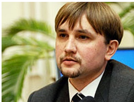
Вятрович просит "бойцов информационной войны" не подыгрывать РФ

Ошибка работников севастопольского управления СБУ, использовавших фотографии из США и России на выставке о Голодоморе, была использована враждебно настроенными российскими СМИ для очередной информационной атаки против Украины.