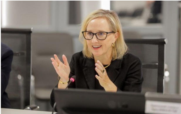
Фото: Джулі Девіс, тимчасова повірена у справах США в Україні (facebook.com/usdos.ukraine)

Тимчасова повірена у справах США в Україні Джулі Девіс покине свою посаду найближчими тижнями через розбіжності з американським лідером Дональдом Трампом.