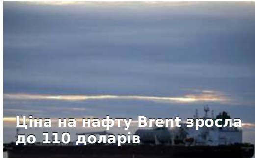
Ціна на нафту Brent зросла до 110 доларів