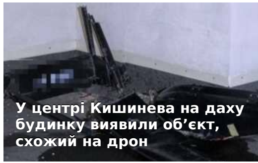
У центрі Кишинева на даху будинку виявили об'єкт, схожий на дрон