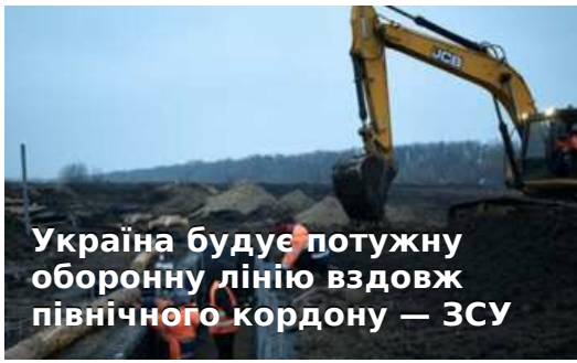
Україна будує потужну оборонну лінію вздовж північного кордону — ЗСУ