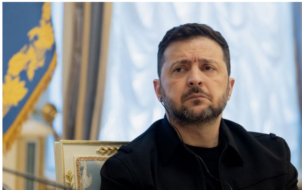
Фото: Володимир Зеленський, президент України

Деякі українські державні компанії не працюють на інтереси держави та держбюджету. Таку ситуацію мають виправити.