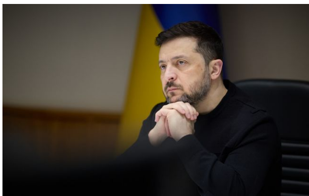
Фото: Володимир Зеленський, президент України

Україна готує свою енергетику до наступного опалювального сезону. У тих громадах, які відставатимуть від графіків, будуть кадрові висновки.