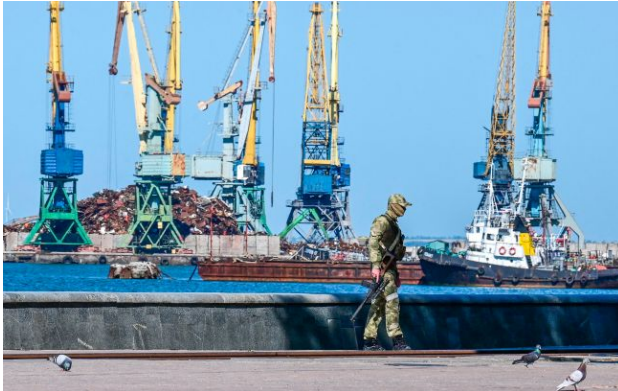
Фото: російські військові (GettyImages)

Росія використовує комплексні методи розвідки для відстеження ситуації на території України, включно з аналізом відкритих джерел і роботою агентури.