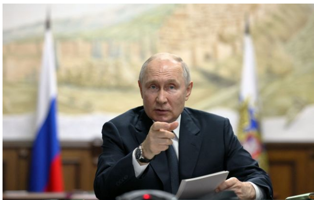
Фото: Володимир Путін, російський диктатор

Російський диктатор Володимир Путін "не помічає" серйозних загроз у зв'язку з українськими заводами щодо нафтопереробного заводу в Туапсе.