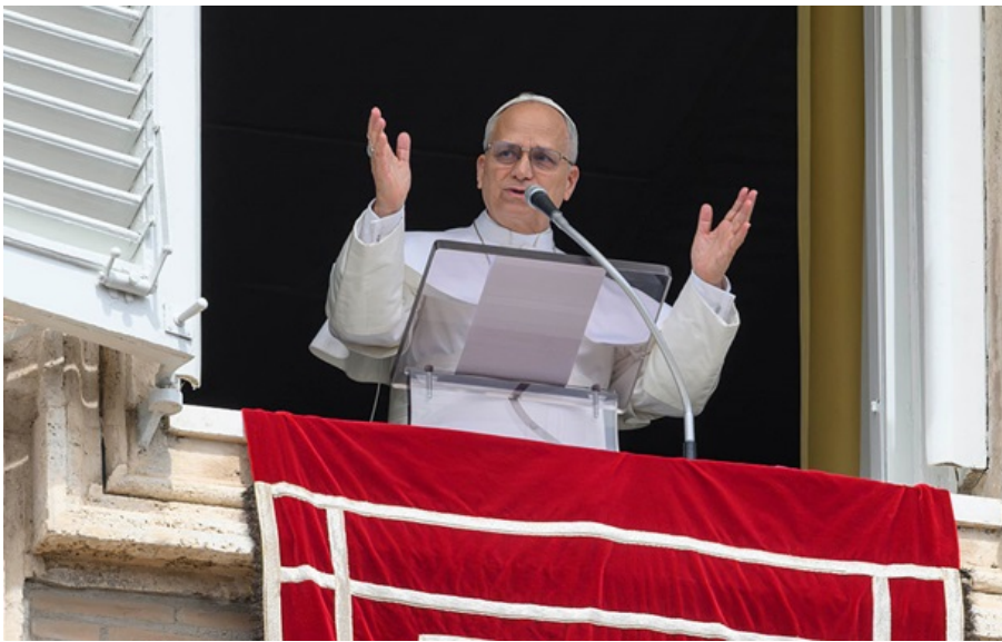
Папа Римський Лев XIV

Під час звернення до вірян східного обряду, понтифік наголосив на необхідності збереження міжнародної підтримки для українського народу.