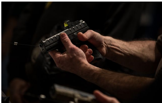
Фото: експерт назвав плюси продажу зброї цивільним

Нааявність зброї у цивільних громадян дозволила б їм не "гинути із зав'язаними за спиною руками", як в Бучі.