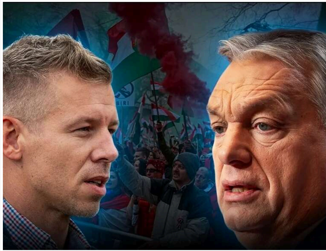
Результати змінюються: «Тиса» утримує загальне лідерство, але «Фідес» виривається вперед за партійними списками

Результати після обробки 6,56% голосів. Опозиційна «Тиса» на першому місці. Цікаво, що за партійними списками партія Орбана випереджає «Тису». А в одномандатних (мажоритарних) округах поки лідирує опозиція.