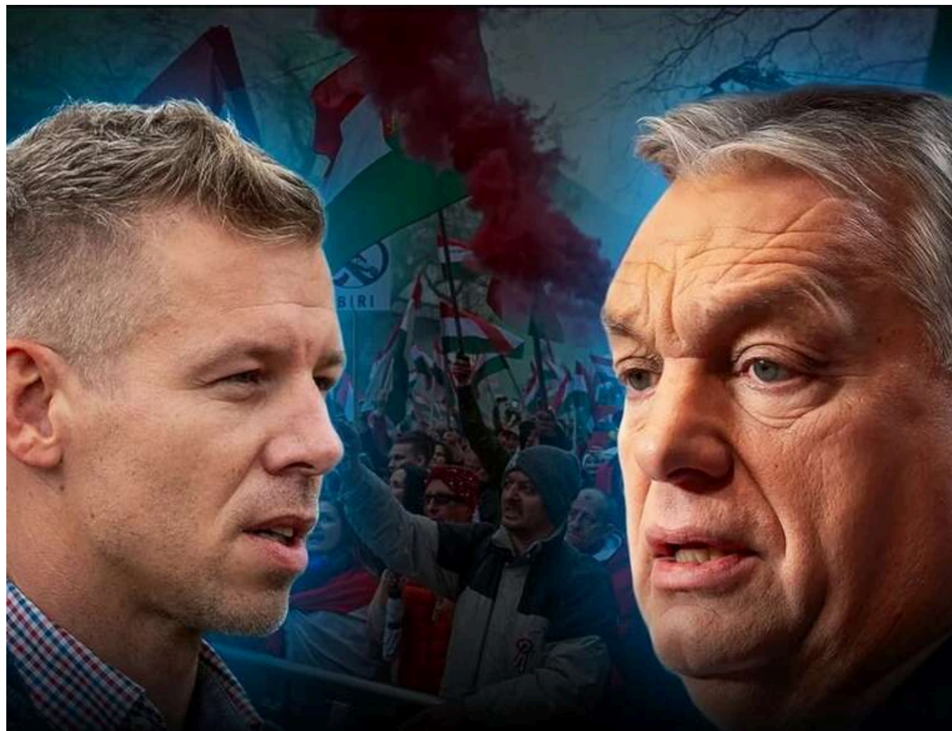
Результати змінюються: «Тиса» утримує загальне лідерство, але «Фідес» виривається вперед за партійними списками

Результати після обробки 6,56% голосів. Опозиційна «Тиса» на першому місці. Цікаво, що за партійними списками партія Орбана випереджає «Тису». А в одномандатних (мажоритарних) округах поки лідирує опозиція.