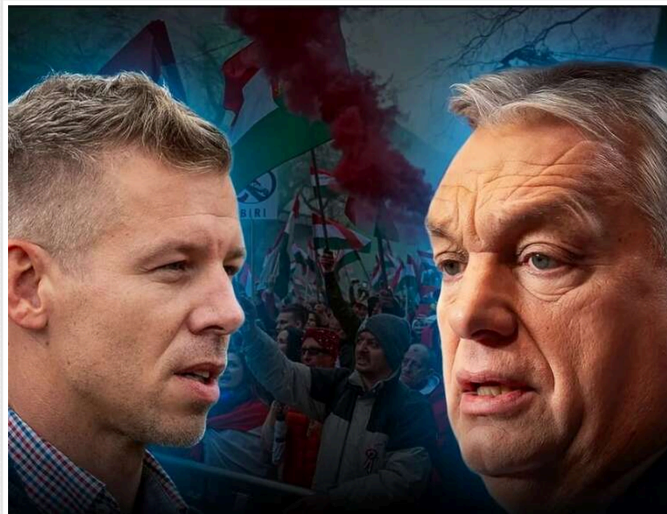
Результати змінюються: «Тиса» утримує загальне лідерство, але «Фідес» виривається вперед за партійними списками

Результати після обробки 6,56% голосів. Опозиційна «Тиса» на першому місці. Цікаво, що за партійними списками партія Орбана випереджає «Тису». А в одномандатних (мажоритарних) округах поки лідирує опозиція.