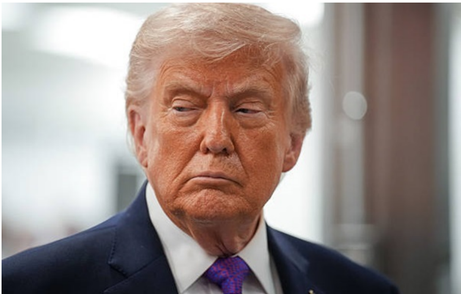
Президент США Дональд Трамп

Глава Білого дому висловив розчарування з приводу висвітлення цієї теми у ЗМІ, однак запевнив, що на переговорах втрата літака не позначиться.