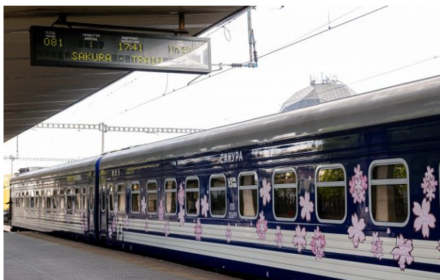
Фото: Новий флагманський поїзд "Сакура" ("Укрзалізниця")

У застосунку "Укрзалізниці" пасажирів помітили нову позначку "Сакура" біля квитків на поїзд №81/82 Київ - Ужгород. Це викликало запитання: що це означає і чи змінюється сам поїзд.