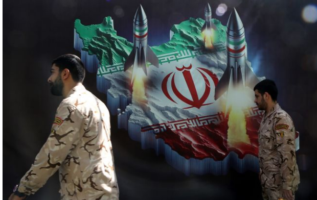
Фото: військові Ірану (GettyImages)

Високопоставлений представник уряду Пакистану, знайомий із перебігом переговорів, заявив, що в Ірані зараз відсутній єдиний центр ухвалення рішень.