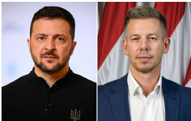
Фото: президент України Володимир Зеленський та майбутній прем'єр Угорщини Петер Мадяр (колаж РБК-Україна)

Майбутній прем'єр-міністр Угорщини Петер Мадяр хоче організувати зустріч із президентом України Володимиром Зеленським уже на початку червня.