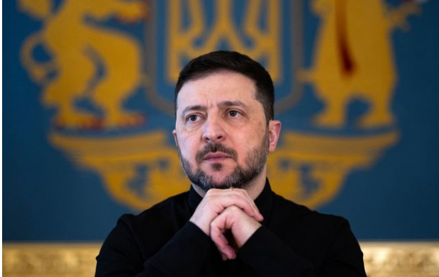
Фото: Володимир Зеленський (Getty Images)

Україна запускає експорт зброї та вже погодила всі деталі на рівні державних інституцій.