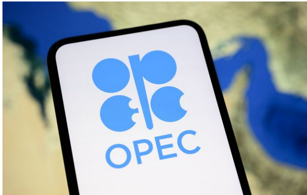
Фото: ОАЕ виходять з ОПЕК

Об'єднані Арабські Емірати вирішили вийти з ОПЕК після шести десятиліть членства в організації. Вихід відбудеться вже цієї п'ятниці, 1 травня.