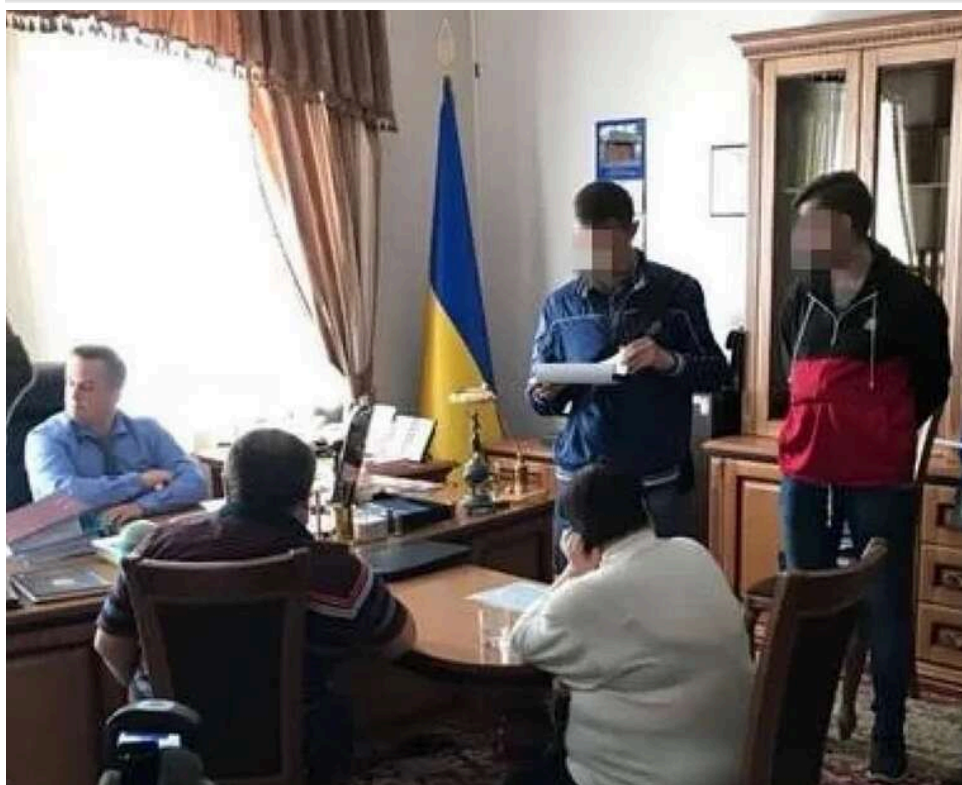
Виправдальний вирок через 9 років: суддю, який приніс 50 тисяч доларів у кабінет Холодницького, визнали невинуватим

Суддю, затриманого з 50 тис. доларів у кабінеті очільника САП Назара Холодницького, виправдали.