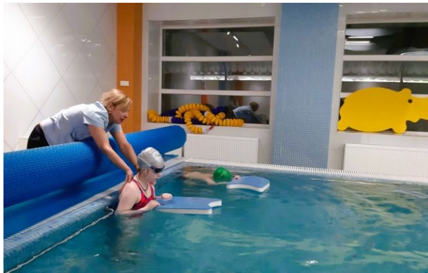
Басейн "Охматдиту" став центром відновлення малечі

У відділенні фізичної та реабілітаційної медицини консультативно-діагностичної поліклініки НДСЛ "Охматдит" МОЗ України розвивають напрям водної реабілітації для дітей із різними діагнозами.